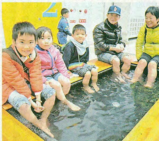
冷えた体を足湯で温める子どもたち

マッサージエリアに足湯 ○…ゴール地点横の西日本総合展示場本館に設けられたマッサージエリアには足湯がお目見えし、ランナーや応援の家族などが、寒さでかじかんだ足先を温め