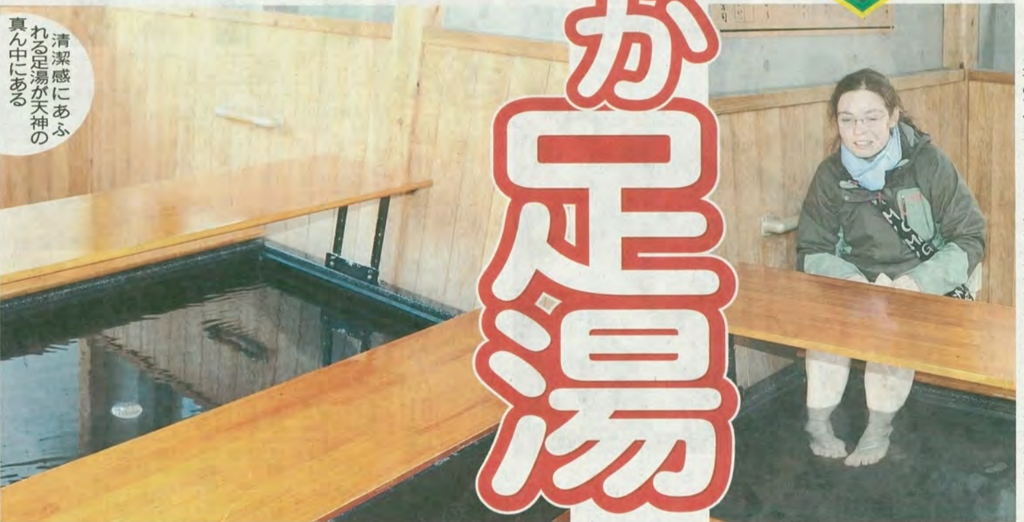
清潔感にあふれる足湯が天神の真ん中にある

警固神社は、西鉄福岡天神駅のあるソラリアビル近くの、福岡藩初代藩主の黒田長政が1608年(慶長13年)に福岡鎮守として現在地に造営。開運と厄払いの神として親しまれてきた。駅の利用者や近くの百貨店の中心商店街で買い物したり飲食店を利用したりする人が行き交う場所にある。