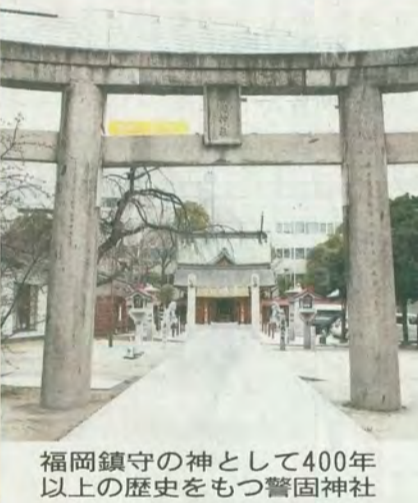
福岡鎮守の神として400年以上の歴史をもつ警固神社

大人なら、ふくらはぎあたりまでを湯につけられる。衛生の保持にも気が配られ、循環式で殺菌効果があるというミネラル水を沸かして給湯している。温度は熱めの42度に保たれている。