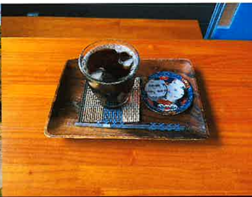
クリスタルで煎れたアイスコーヒー