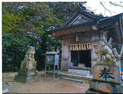
天拝山山頂 天拝神社

天拝いこいの館には、ミネラルクリスタル水を汲める水汲み場が設置してあり、登山者や公園利用者などどなたでもお気軽にご利用できます。また、クリスタルの足湯が常設されており天然ミネラルのコーヒーを飲みながら浸かる足湯は最高で、登山で疲れた足が癒されます。皆様もぜひ、お気軽にお立ち寄りください。