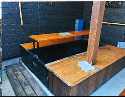
天拝いこいの館 足湯