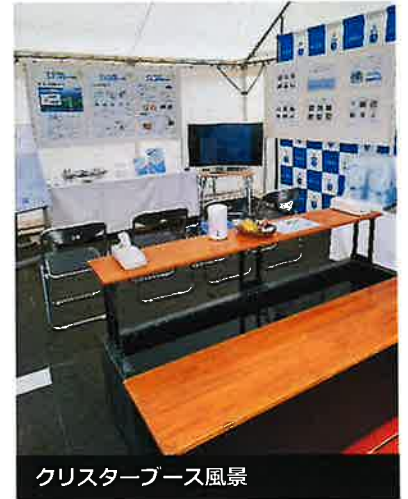
クリスターブース風景

ミネラルクリスターは住まいだけではなく「水」に関わる様々な分野シーンで活躍しています。私たちは、みんなが幸せになる“良い水のまちづくり”の活動を、イベントを通してみなさまにお伝えしていきます。