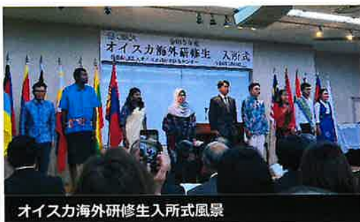
オイスカ海外研修生入所式風景