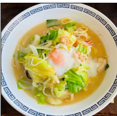
海花亭のちゃんぽん

スープの隠し味に温泉水を使用した温泉街ならではのちゃんぽんです。コクがあり、野菜もたくさん入っていておすすめです。