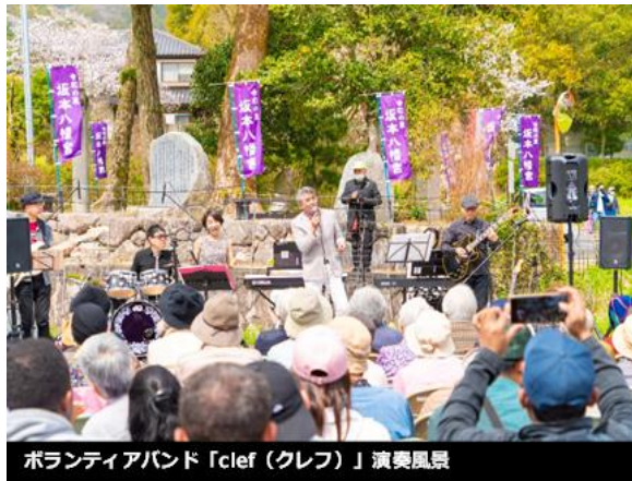
ボランティアバンド「clef (クレフ)」演奏風景

くの来場者にご利用いただきました。さらに当社が支援しているボランティアバンド「clef (クレフ)」が会場を大いに盛りあげました。