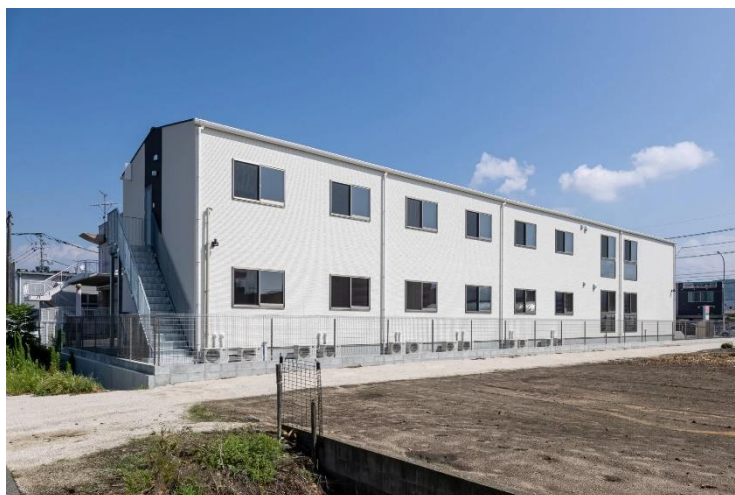
福岡の日中支援型障がい者グループホーム

して生活して頂けるように、バリアフリーであるのはもちろん、手が触れるものはプラチナ触媒コーティングで菌の付着を抑制。イオンクラスターで空気中の菌の抑制を行っておりますので、感染症などから利用者様を守り、安心して生活いただけます。もちろん YOKATOKO 麦野にもミネラルクラスターが導入されています。YOKATOKO 職員さんより、水道水のイヤな臭いがしない、飲み水として美味しい、トイレや水回りの掃除が楽になった、入居者さんが気持ち良さそうにお風呂を利用しているなど喜びの声をいただいております。YOKATOKO 麦野では、衛生的で安心・安全なミネラルクラスターのミネラル水で利用者様の生活を豊かにします。ご興味のある方は、株式会社スエナガへお問い合わせください。