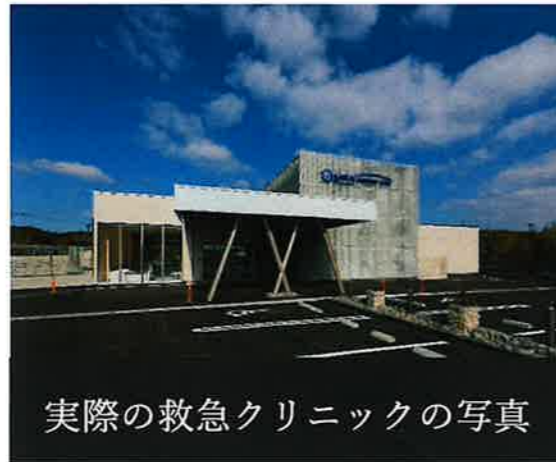
実際の救急クリニックの写真