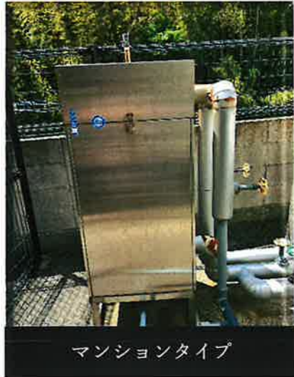
マンションタイプ

下の写真の銀色のボックスの中に入っているのが、マンション用のクリスター装置です。普段は扉が閉まっているため、中を見る機会はほとんどありませんが、この装置が建物全体へ供給される水を支えています。